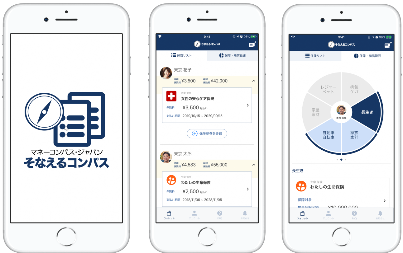
そなえるコンパスの提供イメージ

マネーコンパス・ジャパンが提供するスマホアプリ「おかねのコンパス」は、「管理から活用へ、次の一步を踏み出すためのアプリ」をコンセプトに、保有資産を一元管理する「わかる」、投資サービスを提供する「ふやす」、保険・年金機能を提供する「そなえる」により各サービスと連携した機能を提供いたします。「そなえるコンパス」は「おかねのコンパス」と連携する保険管理を提供するスマホアプリです。